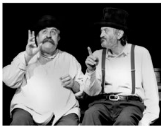
ŠKOLA ŽIVOTA KURS PRO ZAČÁTEČNÍKY, STARŠÍ A POKROČILÉ