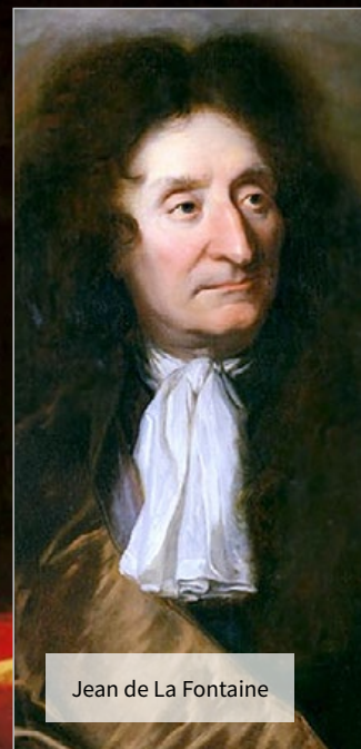
Jean de La Fontaine